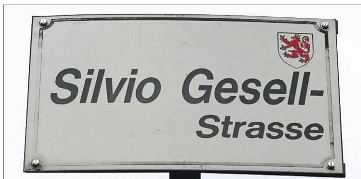
In St.Vith erinnert bis heute die nach ihm benannte Straße an den berühmten Sohn der Stadt.

Als Lösung dieser Missstände schlug Gesell die Einführung von nicht hortbaren »rostenden Banknoten« vor. Sie sollten Angebot und Nachfrage auf den Märkten in ein Gleichgewicht bringen, damit das Zinsniveau allmählich gegen Null absinken könne. Als Folge davon erwartete er Vollbeschäftigung, Geldwertstabilität, eine gerechtere Einkommensverteilung sowie